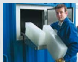
Container + Blockeis