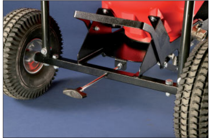
Bodenöffnung für Rest- und Grobschmutz-Entleerung durch Fußhebel entriegelt; Deckel nach hinten gezogen