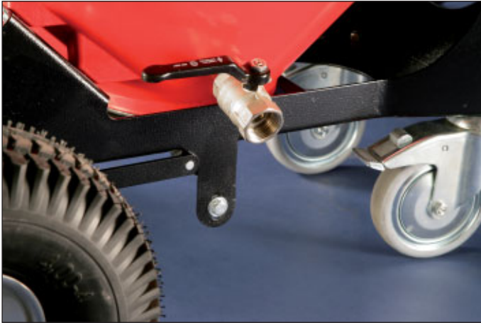
Einfachste Entleerung des Saugers durch Öffnen des Kugelhahnes und Ablassen der Flüssigkeit.