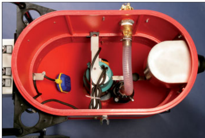
Innenansicht mit eingesetzter Pumpe und Schwimmerschalter für Saugmotor und Pumpe.