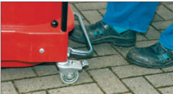
Leichteste "Handhabung" durch Fußhebelentleerung