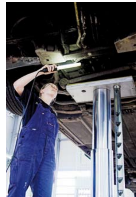
Teleskopstempel mit optionaler Sicherheitsstütze (EN 1493-konform)

Auf Wunsch können die Fundamentwannen mit einer Abnahmebescheinigung gemäß §19 des Wasserhaushaltsgesetzes geliefert werden, denn JAB ist ein Fachbetrieb nach §19 I WHG. Diese Ausführung kann auch problemlos in vorhandene Gruben eingebaut werden, wenn eine Mindestdiefe von 1.450 mm gegeben ist.