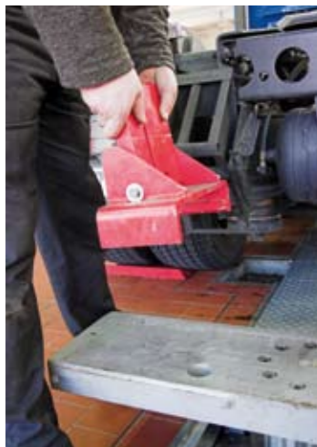
Auswechselbares Aufnahme-Schieber-System zum Anheben verschiedener Fahrzeugtypen.

Die Hebebühne eignet sich für LKW, Sattelzugmaschinen und Standard-Busse mit einer Vorderachse und maximal drei Hinterachsen.