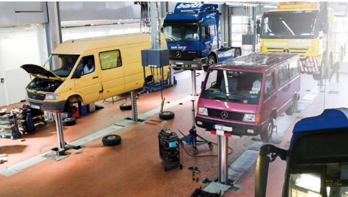
2 HVV Vier-Stempel-Hebebühnen, die als 2 Zwei-Stempel-Hebebühnen benutzt werden.