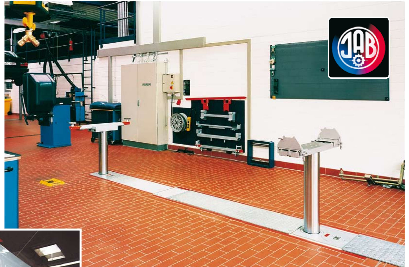
Abbildungen: Zwei-Stempel-Hebebühne, Tragfähigkeit 8.000 kg pro Heberzylinder.

Bei einem Werkstattneubau eignet sich das Betonfundament besonders, wobei optional zwischen einer Teleskop-Schieblechabdeckung (BT) und Segmentblechabdeckung (BS) gewählt werden kann. Bei einem nachträglichen Einbau empfiehlt sich die Stahlfundament-Wanne. Auch hier stehen beide Abdeckungen zur Verfügung.